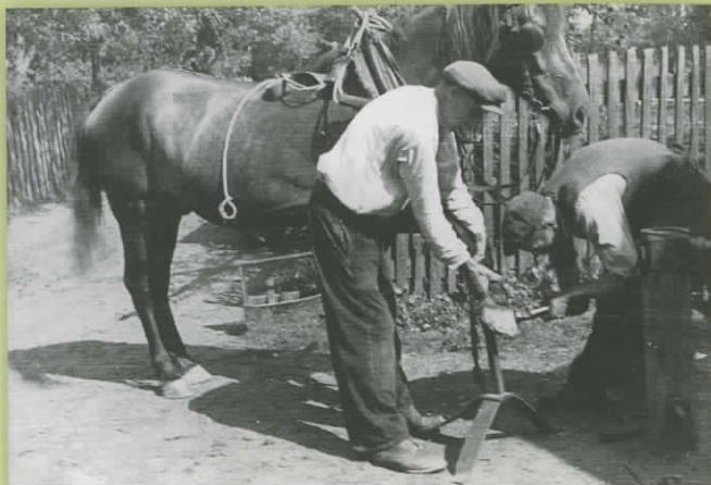
Podkuwanie konia, okres przedwojenny

Kowalstwo należy do najstarszych rzemiosł. Jego rozwój łączy się z upowszechnieniem się użytkowania żelaza. Na naszych ziemiach okres ten przypada na około 700 lat p.n.e. Rozwój kowalstwa jako rzemiosła wiązał się z rozwojem techniki i wzrostem produkcji rolnej w V i VI w. n. e. Od połowy XIII w., w gospodarce czynszowej, nastąpiła częściowa stagnacja rzemiosła wiejskiego, natomiast rozkwitła produkcja miejska. Ponowny rozwój kowalstwa wiejskiego pociągnęła za sobą dopiero gospodarka folwarczno-pańszczyźniana w XVI w.