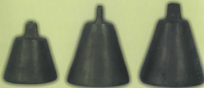
Dzwonki pasterskie dla owiec

Kowalstwo miało zazwyczaj charakter rzemiosła rodzinnego, jednak w jego dziejach wykształciły się aż trzy kategorie zawodowo-społeczne: rzemiosła dworskiego, gromadzkiego lub wioskowego oraz indywidualnego. Podział ten przetrwał do końca II wojny światowej i zanikł wraz z przeprowadzeniem reformy rolnej w latach 1940. Szczególny rozkwit kowalstwa wiejskiego nastąpił w XIX w. W tym okresie wzrosła zamożność chłopów. Rozwój budownictwa zwiększył popyt na różnorakie wyroby kowalskie.