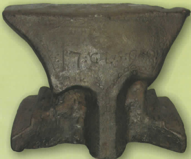
Kowadło z 1798 roku