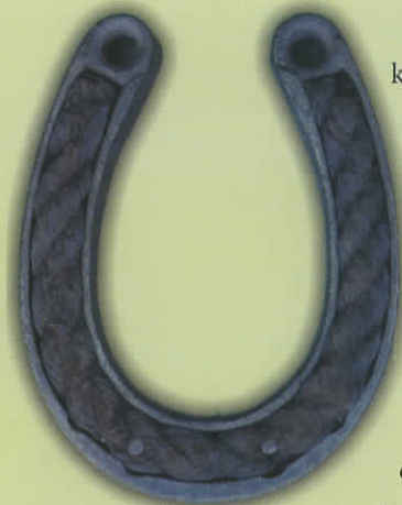
Podkowa wyplatana powrozem

Różnorodność podkówek pod względem kształtu i formy świadczy o dużej wiedzy i umiejętnościach, jakie posiadał kowal. Inne były podkowsy na okres letni, a inne na okres zimowy. Inaczej wyglądały podkowsy dla koni pociągowych, inaczej dla wyjazdowych. Różniły się budową również podkowsy dla